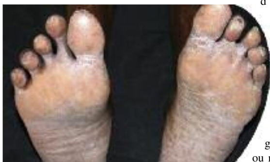
Figure 16 - Scybalidiose.

La scybalidiose correspond à une infection due à des moisissures phytopathogènes ( Natrassia mangifera , Scybalidium dimidiatum et S. hyalinum ) colonisant le sol des zones (sub-) tropicales où l'homme se contamine en marchant pieds nus. Ces agents sont responsables d'une atteinte acrale assez caractéristique lorsqu'elle concerne les mains, se traduisant par une kératodermie farineuse des plis de flexion interphalangiens et palmaires, généralement bilatérale (contrairement à la dermatophytie palmaire plus typiquement unilatérale). Le diagnostic différentiel est constitué par l'hyperkératose palmaire d'origine irritative (maçon). L'atteinte plantaire également bilatérale peut facilement simuler des pieds « mocassin » dermatophytiques d'où son appellation de « pseudo-dermatophytose », ou une autre kératodermie (notamment mécanique, liée à la marche pieds nus) (Fig. 16). On peut observer des intertrigos inter-orteils fissu-