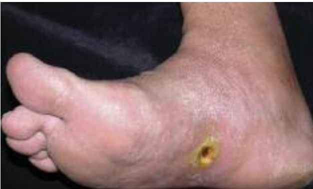
Figure 19 - Piqûre de poisson pierre : l'excision de la nécrose doit être effectuée rapidement.

En conclusion, sous les Tropiques, la marche pieds nus expose particulièrement l'autochtone ou le touriste imprudent aux traumatismes et de ce fait à l'inoculation de multiples infections, aux envenimations parfois mortelles. Il est donc fondamental d'observer les mesures de prévention notamment de rester chaussé y compris sur les plages, de porter des chaussettes le soir, de respecter scrupuleusement les règles d'hygiène et d'effectuer régulièrement une inspection soignée de l'extrémité plantaire. De plus, certaines endémies plus fréquentes ou exclusives à ces contrées, d'origine bactérienne (lèpre, ulcère de Buruli), fongique (mycétome, chromomycose, scytalidiose) ou parasitaire (filarioses) ont un tropisme particulier pour le membre inférieur qu'il importe de savoir reconnaître et traiter précocement ■