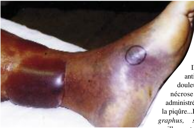
Figure 18 - Envenimation par Echis carinatus compliquée de CIVD.

tiviscérale. L'envenimation scorpionique ne se résume le plus souvent qu'aux seules manifestations loco-régionales : douleurs intenses à type de brûlures ou de broiement. Il n'y a pas d'œdème ou de rougeur après piqûre de buthidés car leurs venins sont dépourvus d'activité enzymatique contrairement aux scorpions chactoides pour lesquels on peut observer une nécrose au point de ponction. Dans moins de 5% des cas, il existe des signes systémiques. Les envenimations et blessures par les animaux aquatiques concernent également tout particulièrement l'extrémité plantaire. Les pterois (« poisson de feu » ou « lion-fish ») et les synancées (« poisson-pierre » ou « stone-fish ») sont venimeux par leurs épines : la douleur est de grande intensité, syncopale, croissante avec le temps. La zone de piqûre est ischémique, oedématiée, dure puis une nécrose extensive et durable apparaît ensuite (Fig. 19). Des collapsus, des détresses respiratoires, des convulsions sont décrits ainsi que des surinfections parfois mortelles par gangrène gazeuse. Le traitement est pourtant simple mais trop souvent méconnu