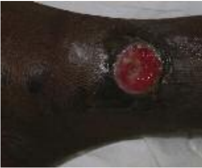
Figure 5 - Ulcère phagédénique.

la périphérie de l'ulcère intéressant le derme profond et l'hypoderme) se caractérise par l'importance de l'inflammation et de la nécrose de l'hypoderme (panniculite septale et lobulaire), par la présence de bacilles acido-alcool-résistants (BAAR) à la coloration de Zielh-Nielsen. L'obtention de colonies sur milieu de Löwenstein-Jensen ou Coletsos est longue et difficile d'où l'intérêt des techniques d'amplification génique (PCR). Le traitement demeure complexe et doit associer une chirurgie large à une poly-antibiothérapie prolongée comportant de la rifampicine, un aminoside ou une fluoroquinolone. Les récurrences sont fréquentes.