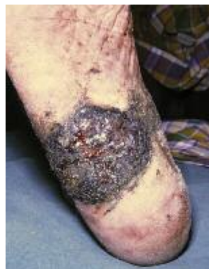
Figure 17 - Mélanome acro-lentigineux

L'épidémiologie des envenimations diffère bien entendu selon le pays concerné et les animaux ou végétaux que les hommes peuvent côtoyer soit à proximité de leur domicile soit dans la nature. Dans les pays en développement, les blessures consécutives sont occasionnées par ordre de prévalence par les prédateurs (les mammifères sauvages dont les félins, les reptiles dont les serpents), les animaux domestiques (dont les chiens et le bétail), les arthropodes. Sous les tropiques les enfants sont les premiers concernés et le pied est volontiers la cible des serpents et des scorpions. Le diagnostic de morsure de serpent n'est pas toujours aisé d'une part parce que le serpent n'a pas systématiquement été aperçu et lorsque c'est le cas, il n'est pas toujours identifié ; d'autre part parce qu'une morsure ne signifie pas obligatoirement envenimation : or tout délai de prise en charge d'une victime grève le pronostic vital. Bien entendu la localisation géographique, la période diurne ou nocturne, le type d'attaque, les signes immédiats et l'évolution loco-régio-