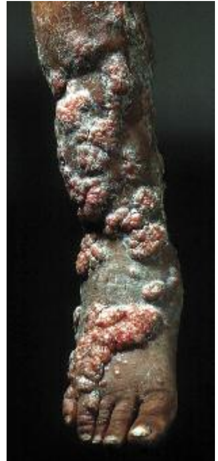
Figure 8 - Tuberculose verruqueuse simulant une chromomycose.

nomycétomes est basé sur l'antibiothérapie, celui des eumycétomes sur l'utilisation prolongée (durant plusieurs mois) des antifongiques. La chirurgie demeure néanmoins souvent nécessaire en zone d'endémie du fait du caractère évolué des lésions mais elle est désormais plus conservatrice.