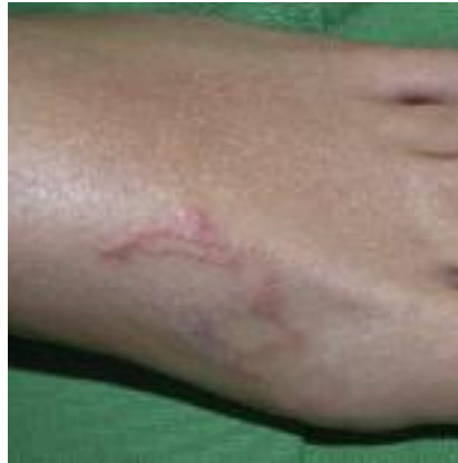
Figure 13 - Larva migrans cutanée.

Les larva migrans cutanées sont rapidement évoquées devant la présence de sillons serpiginoux plantaires (larbisch, creeping disease) qui correspondent à une impasse parasitaire due à Ankylostoma braziliensis , caninum (chien), A. ceylanicum (chat). Les larves strongyloïdes issues des fèces de chiens parasités, errants sur les plages tropicales, pénètrent la peau préférentiellement sur les zones au contact du sable de la plage (plantes > fesses > tronc). Les sillons sont caractérisés par leur finesse et leur longueur (10cm x 5mm), leur progression lente (quelques cm/j), leur persistance (disparition en quelques semaines) et la fréquence de leur eczématisation ou de leur impétiginisation (Fig. 13), permettant