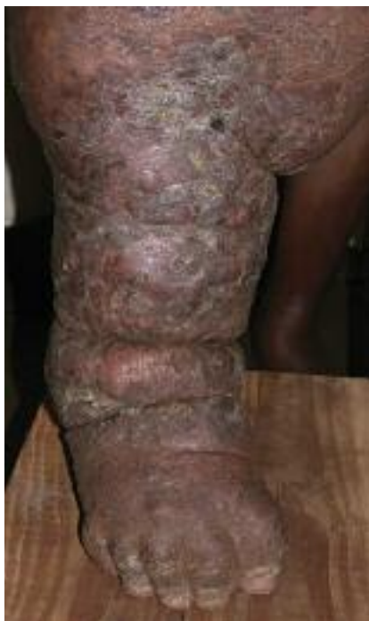
Figure 9 - Elephantiasis (cliché J-J. Morand).

La dracunculose due à Dracunculus medinensis , à tort appelée « filaire » de Médiéne est en voie d'éradication ; elle demeure présente essentiellement au Soudan, au Nigeria et au Ghana. Le cycle naturel dure environ un an chez l'homme, hôte définitif préférentiel du parasite. Le ver femelle adulte, arrivé à maturité, migre à la peau et crée une ulcération cutanée généralement au niveau de la cheville. Au contact de l'eau, le ver expulse ses embryons puis meurt. L'hôte intermédiaire est un crustacé d'eau douce, le cyclops. L'homme s'infecte en buvant l'eau d'un puits ou d'une mare contaminée par les cyclops porteurs de larves. L'émergence du ver à la peau est douloureuse surtout à la voûte plantaire ; elle est précédée par un prurit, un léger œdème (où l'on devine parfois un cordon induré pelotonné correspondant au ver long de 50 à 80 cm !) puis une phlyctène suivie d'une ulcération de 5 à 10 mm de diamètre au fond de laquelle on perçoit le parasite. Le site de prédilection est la malléole externe. Le risque de surinfection (érysipèle, abcès sous-