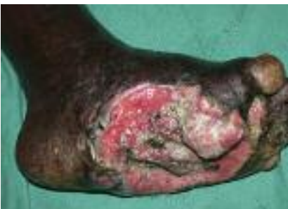
Figure 6 - Carcinome verruqueux compliquant un mal perforant lépreux.

L'ulcère phagédénique tropical constitue une entité nosologique floue en raison de sa physiopathogénie incertaine bien que présumée infectieuse ; de plus la démarche étiologique sous les tropiques est souvent non exhaustive et il est parfois confondu avec des ulcères d'une autre origine. Il se caractérise cependant par la survenue subaiguë en quelques semaines, généralement chez l'enfant de 5 à 15 ans (dans deux tiers des cas) vivant en milieu tropical volontiers humide, le plus souvent après un traumatisme, d'une papule inflammatoire rapidement suivie d'une ulcération initialement douloureuse, régulière, arrondie, profonde, à bords saillants, à fond bourgeon-