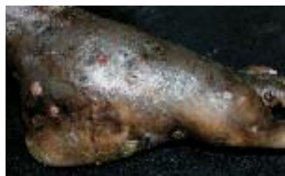
Figure 7 - Mycétome.

Le mycétome correspond à une infection lentement évolutive des tissus sous-cutanés résultant du développement soit de champignons (eumycétomes) soit de bactéries (actinomycétomes) de différentes espèces, tous saprophytes du sol et des végétaux épineux des régions semi-désertiques sub-tropicales. Cela explique la localisation préférentielle au pied (dit « de Madura ») (Fig. 7). L'incubation est de quelques semaines à plusieurs années après contamination transcutanée. Progressivement et de manière indolore, se développe une tuméfaction qui se fistulise avec émission d'un matériel séro-sanglant contenant des granules de couleur et d'aspect variables suivant l'agent pathogène : les grains noirs sont toujours fongiques, les grains rouges, beiges et jaunes sont toujours bactériens, les grains blancs peuvent être fongiques ou bactériens. L'infection peut atteindre les fascias, les muscles et les os. Le traitement des acti-