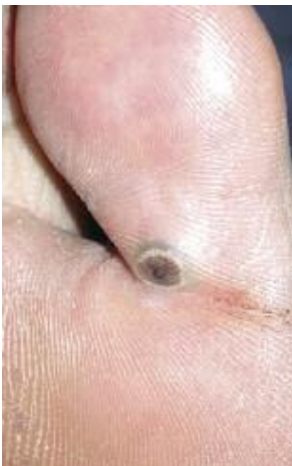
Figure 12 - Tungose.

teum ) comporte également des lésions dyschromiques acrales à la fois hyper et hypopigmentées. Le pian (ou yaws, framboesia, parengi, paru, bouba, du à T. pallidum ssp pertenue ), contrairement au bejel (ou syphilis endémique, firjal du à T. pallidum ssp endemicum ), atteint outre les muqueuses, l'ensemble du tégument notamment l'extrémité plantaire. L'hyperkératose palmo-plantaire fissuraire à travers laquelle font irruption les pianomes est très douloureuse, gênant la marche d'où le terme de pian-crabe (Fig. 15). L'hygrométrie semble influencer le caractère plus ou moins suintant et végétant des lésions; le principal diagnostic différentiel des pianomes est constitué par les pyodermites végétantes. Les pianides, lésions papulo-squameuses circonscrites volontiers prurigineuses (pian-dartre) simulent nombre d'affections et pourraient justifier aussi le surnom de « grande simulatrice » à cette infection. Le diagnostic d'une tréponématose non vénérienne dite endémique est posé devant la conjonction d'un contexte épidémiologique, d'une symptomatologie évocatrice (polydactylite, atteinte muqueuse pseudo-condylomateuse, gommages, ostéopériostite déformante...) et la positivité de la sérologie syphilitique (TPHA + VDRL). La benzathine pénicilline (Extencilline®) par voie intramusculaire reste l'antibiotique de référence.