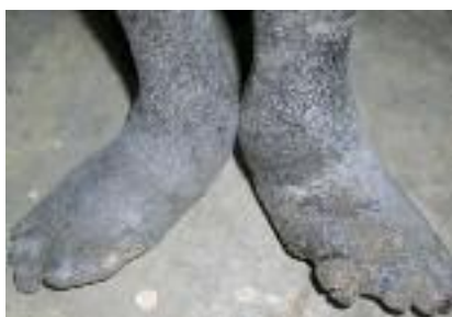
Figure 2 - Déformation plantaire d'origine lépreuse, mal perforant et amputation des orteils à type de pseudo-aïnhum.

tion du calcanéum. Le traitement des mutilations et des surinfections est souvent décevant, c'est pourquoi la prévention est essentielle ; elle repose avant tout sur le dépistage et le traitement précoce médico-chirurgical des réactions lépreuses. L'éducation des malades (surveillance, hygiène des pieds), la protection des extrémités par le port de chaussures adaptées (sandales aérées, lavables, solides avec système de fermeture non traumatisant, forme berçante, semelle interne en mousse évidée en regard des kéra-toses, semelle externe rigide et résistante), la correction des déformations par la rééducation fonctionnelle et la chirurgie constituent les fondements de la prophylaxie du mal perforant plantaire et de l'ostéo-arthropathie lépreuse.