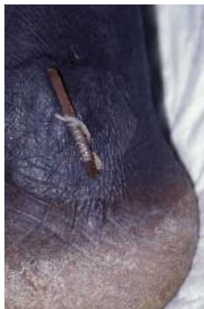
Figure 11 - Dracunculose.