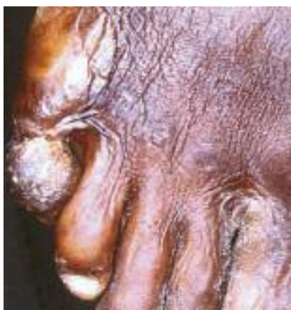
Figure 3 - Aïnhum : atteinte du 5 e orteil.

L'aïnhum est une affection tropicale d'origine inconnue se traduisant par une constriction fibreuse progressive du pli digito-plantaire avec lyse osseuse, siégeant bilatéralement au cinquième orteil, parfois au quatrième orteil, exceptionnellement aux doigts aboutissant à l'amputation spontanée ( Dactylolysis spontanea ) (Fig. 3). Le pseudo-aïnhum qui peut concerner n'importe quel orteil ou doigt, survient à tout âge,