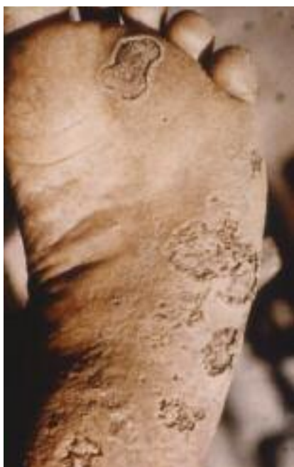
Figure 15 - Pian crabe.

La scybalidiose correspond à une infection due à des moisissures phytopathogènes ( Natrassia mangifera , Scybalidium dimidiatum et S. hyalinum ) colonisant le sol des zones (sub-) tropicales où l'homme se contamine en marchant pieds nus. Ces agents sont responsables d'une atteinte acrale assez caractéristique lorsqu'elle concerne les mains, se traduisant par une kératodermie farineuse des plis de flexion interphalangiens et palmaires, généralement bilatérale (contrairement à la dermatophytie palmaire plus typiquement unilatérale). Le diagnostic différentiel est constitué par l'hyperkératose palmaire d'origine irritative (maçon). L'atteinte plantaire également bilatérale peut facilement simuler des pieds « mocassin » dermatophytiques d'où son appellation de « pseudo-dermatophytose », ou une autre kératodermie (notamment mécanique, liée à la marche pieds nus) (Fig. 16). On peut observer des intertrigos inter-orteils fissu-