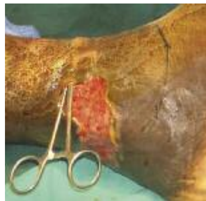
Figure 4 - Ulcère de Buruli : observez le large décolllement des berges de l'ulcération résultant de la lyse hypodermique par la mycolactone sécrétée par Mycobacterium ulcerans (cliché MC C. Drouin)

La mise en évidence des mycobactéries à l'examen direct est difficile et nécessite des prélèvements répétés sous les berges de l'ulcère. L'histologie (biopsie à