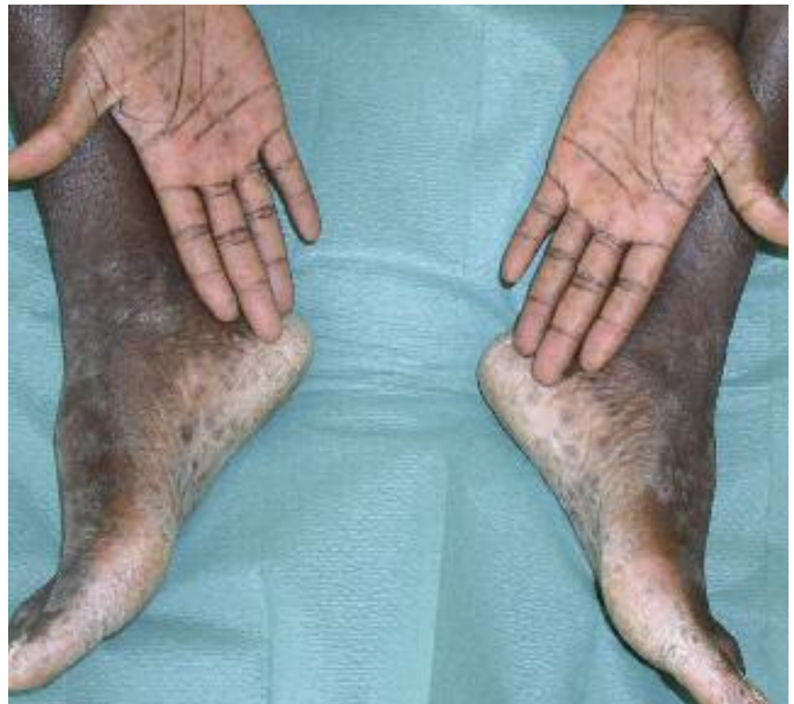
Figure 14 - Syphilis secondaire : notez la collerette de Biett.