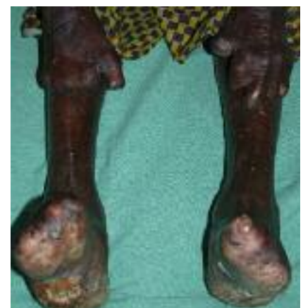
Figure 1 - Lèpre : mutilations des extrémités.

multiples aboutissent à des mutilations sévères avec amputation spontanée des orteils (« pied télescopique ») (Fig. 2), à un effondrement de la voûte plantaire avec écrasement et, à l'extrême, saillie en avant du scaphoïde, donnant à la plante un aspect convexe (« pied en bateau »), rapidement compliqué d'un mal perforant. L'effondrement de l'arche externe résulte de la lyse du cuboïde et parfois du 5 e métatarsien, favorisée par un mal perforant surinfecté en regard. La déformation du pilier postérieur est la conséquence de la destruc-