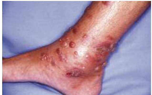
Figure 20 - Papillonegative guyanaise.