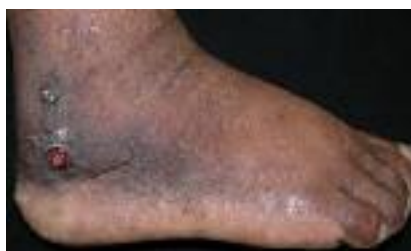
Figure 10 - Maladie de Kaposi (cliché J-J. Morand).